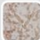
클리도스포리움균 알레르기 유발