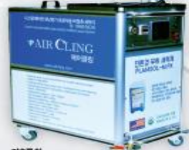
기술특허 (출원번호 10-201001950000호) 디자인특허출원번호 제30-2019-0711204호

공기팔팔한 세상을 만들어갑니다 “ 에어컨이 있는 곳이면 어디든지 에어클링이 함께합니다 ”