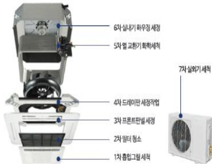
(주)나래플러스 에어클링 시스템에어컨 로봇 자동세척기 장비 제원