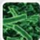
레지오넬라균 급성호흡기 감염